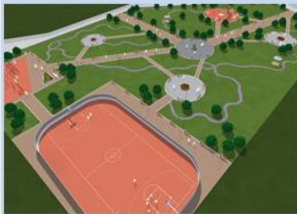
Площадка для воркаута